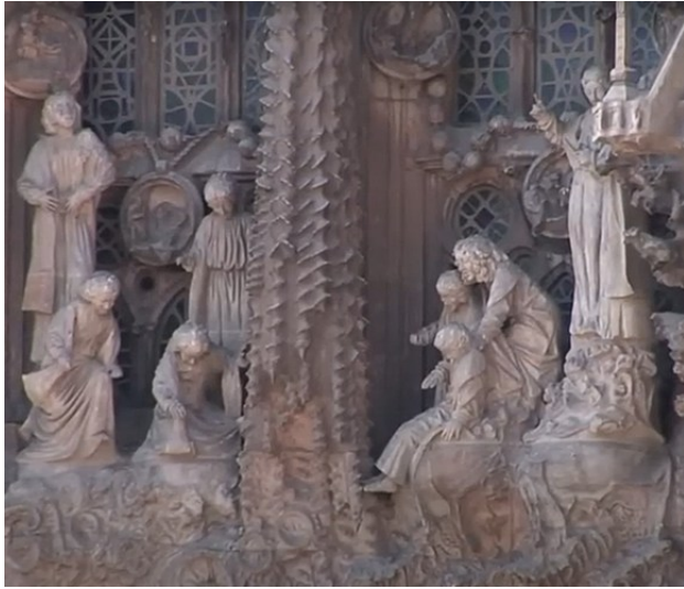
サグラダ・ファミリア (スペイン)

スペイン・バルセロナにあるサグラダ・ファミリアは、建築家アントニ・ガウディが設計した壮大なカトリック教会