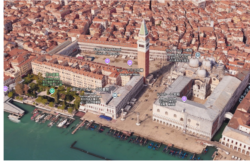
ベニス の サンマルコ広場（イタリア）

スペイン・バルセロナにあるサグラダ・ファミリアは、建築家アントニ・ガウディが設計した壮大なカトリック教会