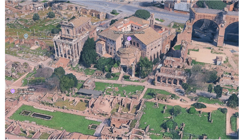
古代ローマ フォロ・ロマーノ (イタリア)

黄金のモザイクが輝き、東西文化が融合した壮麗な大聖堂。ベネチアの象徴として多くの人々を魅了する名所。