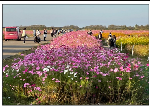
宮ノ下公苑のコスモス