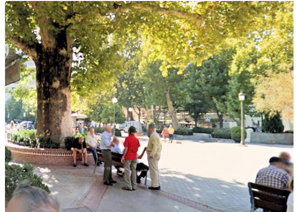
右下をカットした画像の画像