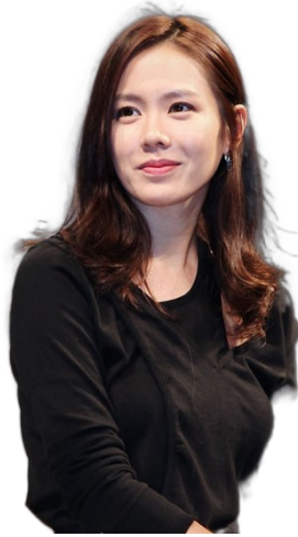
人物だけを切り出し