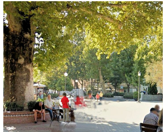
画像から3人を消去