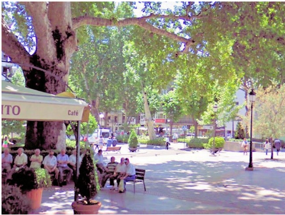
同じ場所の実際の写真（以前吉岡画撮影）