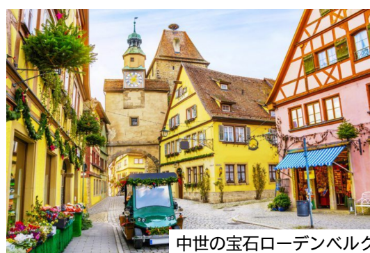
中世の宝石ローデンプルグ

今月は、ドイツのロマンティッククック街を訪問してみよう。ロマンティック街は、ドイツのロマンティック街(ローレンツブルク、ディンケルスビュールなど)や美しい城(ノイシュヴァンシュタイン城、ハルブルク城など)の建築、工芸品が点在し、フランクエン・ワイン