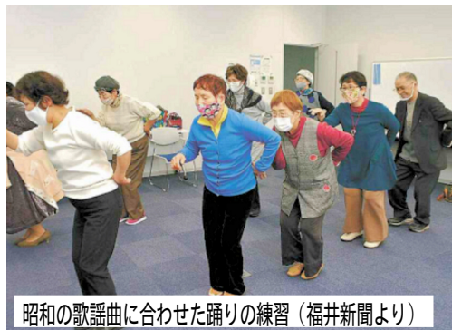
昭和の歌謡曲に合わせた踊りの練習 (福井新聞より)

い必どりて障一陀タ成本にパ十七と 普本工縁を一年 演 仏ずも一か・そ、一さ願はは七長蓮及最大ら人が建てに、蓮が と極疑こか三、れ、そ、ゲせ寺吉マンの、子、回、の、結、八、十