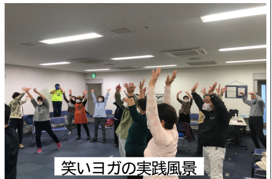
笑いヨガの実践風景

笑いヨガの実践風景。参加者は、笑顔になりながら、体を動かす。笑いヨガは、ストレスを解消し、心身をリラックスさせる効果がある。実践風景は、参加者が笑顔になり、手を高く上げて喜んでいる様子。