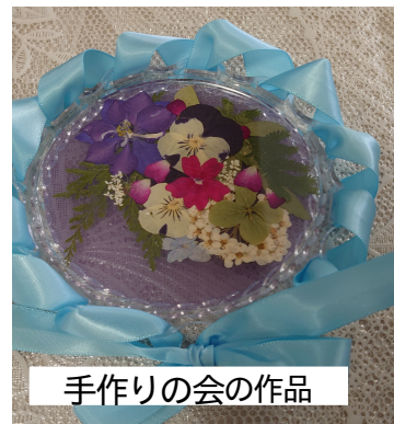
手作りの会の作品