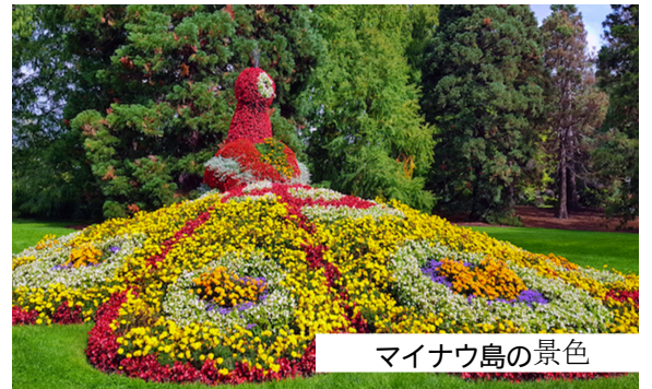
マイナウ島の景色

今月は、ドイツの南部へ行きましょう。スイスとの国境に近いボーデン湖に浮かぶ「花の島」マイナウ島は、