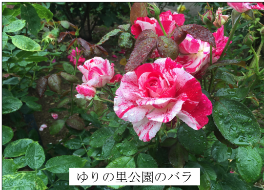
ゆりの里公園のバラ