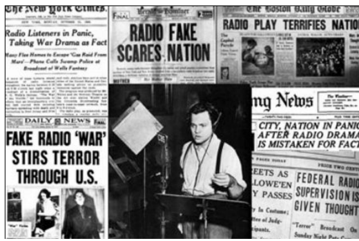
メディアで大きく報道された火星来襲騒ぎ

どうやら人間はだまされやすい。有名な話があり、一九三八年十月三十日ハロウインに沸くアメリカで起きたことだ。『マーキュリー放送劇場』というラジオ番組が突如臨時ニュースが流れ、火星人が襲来したというので、アメリカ人がパニックを起こしたと言います。実際は有名作家のSF小説『宇宙戦争』をもとにした作り話だったのです。現在では、科学だ、と証明されていきますが、ドイツ人こそ、つとも純