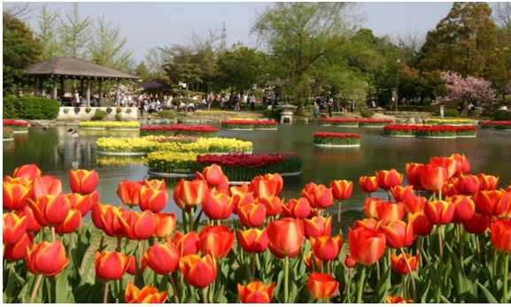
砺波のチューリップ公園