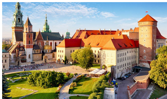
クラクフ歴史地区

三月はポーランドの第一回目として、首都・ワルシャワを見ましたが、ポーランドには、ほかに