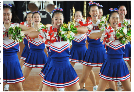
福井商チアリーダー部 全米V5