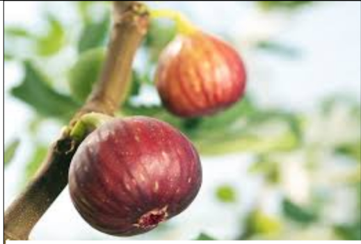
実りの秋 (イチジク)