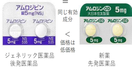
ジェネリック医薬品の例

いつた大変なプロセスを経た初めて製中化するもので、新薬を開発できる製薬会社はおのずと限られます。また、新薬の開発に成功すれば、特許を取り専売をすることができず。しかし、出願から二十年という特許の権利期間が終わるころを狙って、新薬開発は無理な製薬会社が全く同じ薬効成分を含む薬を作り始めます。しかし、薬効成分は同じであつても、薬に仕上げる賦形剤がわからないので、全く同じ薬を作ることにはむづかしいのです。政府は、薬価を下げるために、服用後の血中の薬効成分の濃度を測り、それが本物とほぼ同じであれば、ジェネリック薬品として認可します。ジェネリックの薬はその薬を開発した会社の本来の製品よりも価格が安いのです。特許が切れた後は、ジェネリック薬の製