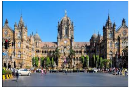
チャトラパティ・シヴァージー・ターミナス駅

映画鑑賞会 二月は、洋画「夜の犬捜査線」邦画「いいかげん馬鹿」を上映しました。見たい映画がありましたら主宰者(090-1392-5405)迄お知らせください。 インターネット世界旅行 今回はインド最大の都市ムンバイの歴史と主要観光地をの紹介とします。