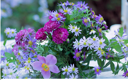
秋から初冬の庭を彩る野菊