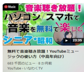
ズスマホで無料の音楽を楽しむ方法

お断り 今月号から、発行の月表示を、ひと月繰り下げ、配布開始時の月表示としました。