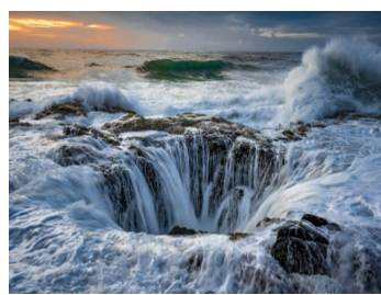
海水を飲み込むトルの井戸(アメリカ)

映画鑑賞会 十一月は、洋画は大道芸人とその相棒の女の旅暮らしを通じて、人生の哀歓を綴ったドラマ「道」を、邦画は「羅生門」を上映しました。十二月もいくつかの候補の中から見たいと参加者が決めてものを上映します。 インターネット世界旅行 案内先 別されます。七百一年当時の都は藤原京、七百年に平城京に都が移され、名実共に奈良王朝が成立しました。王朝交代の実相をお話しします。