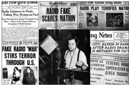
メディアで大きく報道された火星人襲来騒ぎ

どうやら人間はだまされる。有名な話があり、その一つは、一九三八年十月三十日、ハリウッドに沸くアメリカで起きたことだ。『マーキュリーラジオ放送劇場』というラジオ番組が、突然臨時ニュースが流れ、この火星人が襲来したという。火星人が襲来したと言います。実際は有名作家のSF小説『宇宙戦争』をもとにした。語り手は、そのとき、みんなどまされたのです。現在では、科学だと言われている。ドイツ人こそ、つとも、純