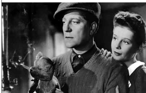
7月7日(火) 開催 映画の中の一シーン

六階建てのアパート。住人たちの交流の場となつて、螺旋階段の最上階の部屋から銃声がした。中から傷を負つて出てきた男は階段を駆け落ちて命を落とす。住人たちは右往左往、噂話に大忙しだ。部屋の中にいるのはフランソワ(ジャン・ギャバン)という男で、彼が男を撃ち殺した犯人のようだ。やってきた警官に威嚇射撃したこと、警察も武装し、向かいの建物やアパートの屋根に潜んで包囲網を形成していく。追い詰められたフランソワは銃