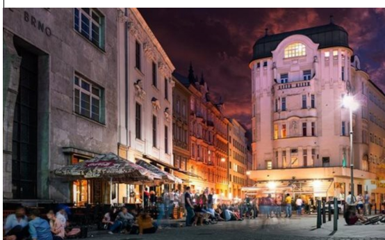
7月31日(金) 開催 ブルノの街の風景